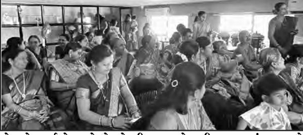
જેમનો બર્થ-ડે હતો તેમને ટીચારા પહેરાવી મહામૃત્યુંબંધ અને

ગાયત્રી મંત્રના જાપ કરી તેમની મંગલ કામના માટે પ્રાર્થના કરી. ત્યાર બાદ સર્વે બહેનોને હલ્દીકંકુ લગાવી તિલગુડ અને વહાણ ગીફ્ટ આપવામાં આવ્યા હતા. સાથે સાથે રીલ બનાવી સૌના ઉત્સાહમાં વધારો કરવામાં આવ્યો હતો. ગેમ્સ રમાડી ગીફ્ટ આપવામાં આવ્યા હતા અને ઘટકના સદસ્યોને સમાજ તફરથી ઇમરજન્સી દવાઈની કીટ આપવામાં આવી હતી. અંતમાં બધાએ અલ્પાહાર લઈ કાર્યક્રમને વિરામ આપ્યો હતો.