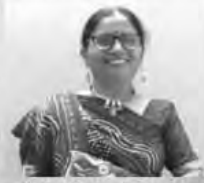
શ્રીમતિ નિર્મળાબેન ચાવડા (અંજાર) - મંત્રીશ્રી