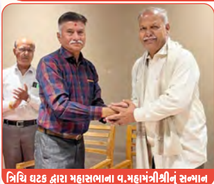
ત્રિચિ ઘટક દ્વારા મહાસભાના વ.મહામંત્રીશ્રીનું સન્માન