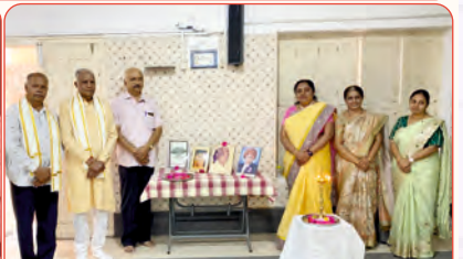
મુદરાઈ ઘટકના કાર્યક્રમનું દિપ પ્રાગટ્ય કરતા મહાસભા પ્રમુખશ્રી