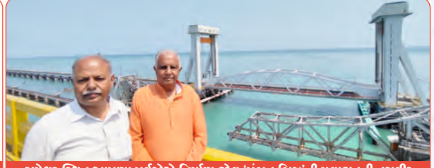
રામેશ્વર સ્થિત આપણા પૂર્વજોએ નિર્માણ કરેલ 'પંબન બિજ'ની મુલાકાતની તસવીર