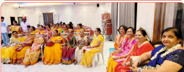
સ્નેહમિલન સમારોહમાં ઉપસ્થિત કલબુર્ગી ઘટકના બહેનો