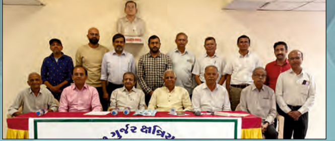
તામિલનાડુ પ્રા. અંતર્ગત આવતા કોઈમ્બતુર ઘટકની મુલાકાત વેળાની સમુહ તસવીર