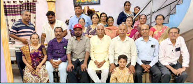
તામિલનાડુ પ્રા. અંતર્ગત આવતા ચેન્નાઈ ઘટકની મુલાકાત વેળાની સમુહ તસવીર