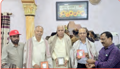
મહાસભા પ્રમુખશ્રીનું ચેન્નાઈ ઘટક દ્વારા સન્માન