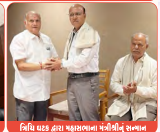
ત્રિચિ ઘટક દ્વારા મહાસભાના મંત્રીશ્રીનું સન્માન