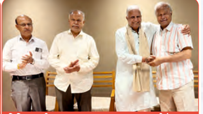
ત્રિચિનાપલ્લી ઘટક દ્વારા મહાસભાના આદ. પ્રમુખશ્રીનું સન્માન