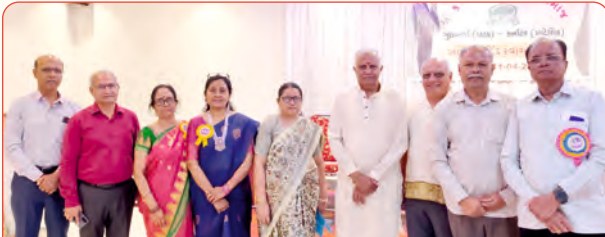
કલબુર્ગી ઘટકના હોદ્દેદારો સાથે મહાસભાના હોદ્દેદારશ્રીઓ