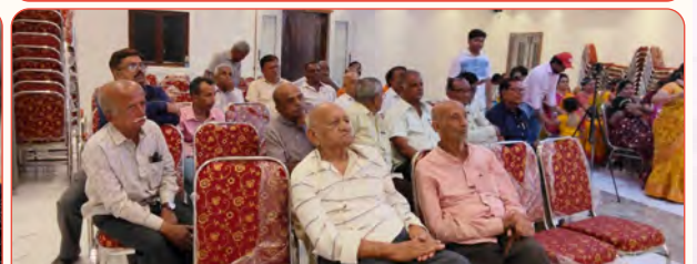
સ્નેહમિલન સમારોહમાં ઉપસ્થિત કલબુર્ગી ઘટકના ભાઈઓ