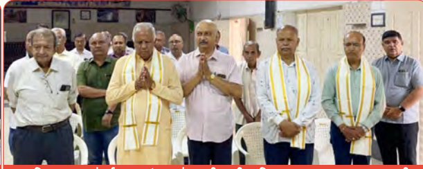
તામિલનાડુ પ્રા. અંતર્ગત મદુરાઈ ઘટકમાં પ્રભુશ્રીરામની સ્તુતિ કરતા મહાસભાના આદ. પ્રમુખશ્રી