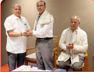
ત્રિચિનાપલ્લી ઘટક દ્વારા મહાસભાના મંત્રીશ્રીનું સન્માન