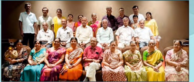
તામિલનાડુ પ્રા. અંતર્ગત આવતા ત્રિચિનાપલ્લી ઘટકની મુલાકાત વેળાની સમુહ તસવીર

શ્રી કચ્છ ગુર્જર ક્ષત્રિય સમાજ મહાસભા ગુજરાત પ્રાદેશિક સમિતિ પ્રેરિત એવં ઓખા મંડળ ટ્રસ્ટ આયોજીત મહાસભાની અર્ધવાર્ષિક બેઠક એવં અખિલ ભારતીય સ્તરનું વિરાટ સગાપણ સંમેલન તારીખ : ૦૬ અને ૦૭ જુન-૨૦૨૬, શનિવાર, રવિવાર - દેવભૂમિ દ્વારકા