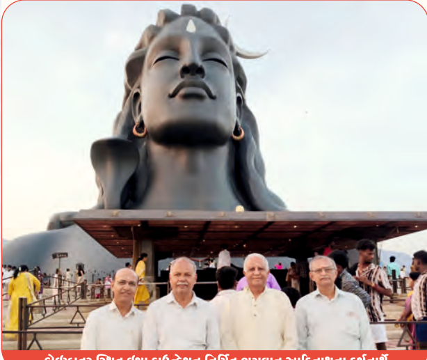
કોઈમ્બતુર સ્થિત ઈશા કાઉન્ટેશન નિર્મિત ભગવાન આદિનાથના દર્શનાર્થે