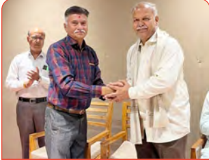
ત્રિચિનાપલ્લી ઘટક દ્વારા મહાસભાના વ.મહામંત્રીશ્રીનું સન્માન