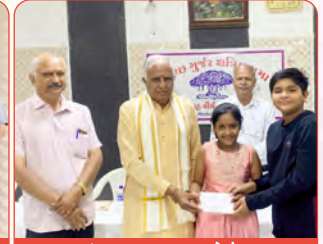
મદુરાઈ ઘટકના બાળકલાકારોનું સન્માન