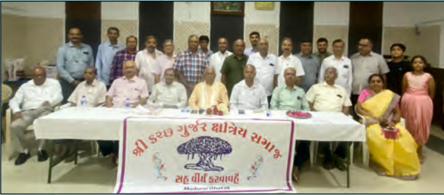
તામિલનાડુ પ્રા. અંતર્ગત આવતા મદુરાઈ ઘટકની મુલાકાત વેળાની સમુહ તસવીર